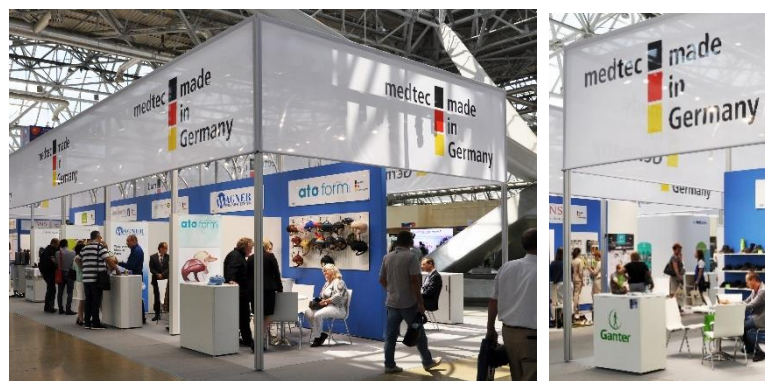
Standbaukonzept: deutscher Stand für Medizintechnik